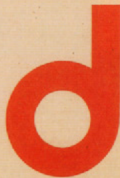
HERBERT BAYER: Abb. 1. Alfabet „g“ und „k“ sind noch als unfertig zu betrachten

a b c d e f g h i j k l m n o p q r s t u v w x y z